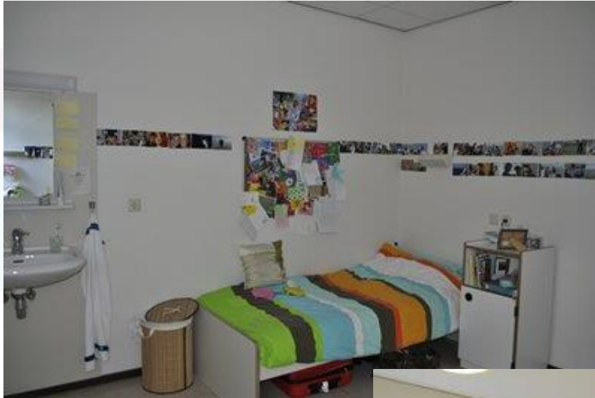
Slaapkamer op de kliniek